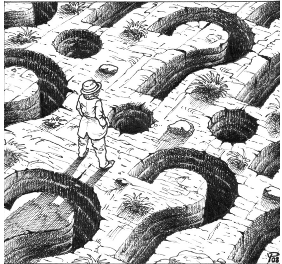
Illustration de Yanniss Plomb, Témoinages autour de la survivance, 2009

- En prenant conscience de l'impact sur sa vie d'une menace ou d'un stress pendant sa gestation ou de la perte d'un frère ou d'une sœur décédé avant ou au moment de la naissance, ce qui a pour nom la survivance. On ne réalise pas, en effet, que ces personnes peuvent vivre avec le sentiment plus ou moins conscient qu'ils pourraient eux aussi mourir dans un proche avenir et ne se donnent pas le droit d'exister pleinement et de développer leur potentiel. Il faut aider les personnes concernées à comprendre qu'ils sont survivants, à reconnaître leurs symptômes et à faire le deuil de l'enfant décédé.